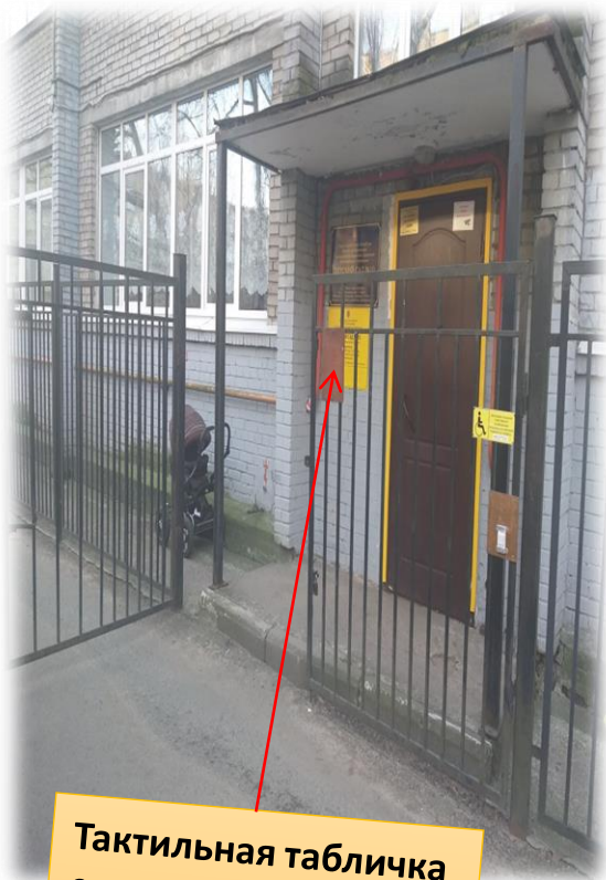
Тактильная табличка с шрифтом Брайля «Вызов помощи»